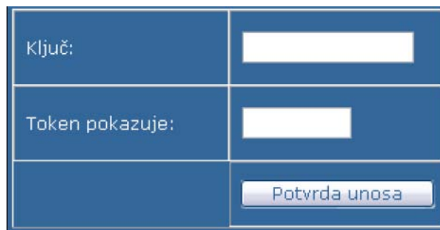
Слика 5. Форма за унос података за деблокирање токена

Тек након прве исправне пријаве без кључа, видећете поруку да је Ваш токен блокиран. У том случају, неопходно је да урадите деблокирање свог токена, избором опције „Дебл.токена” (Слика 5).