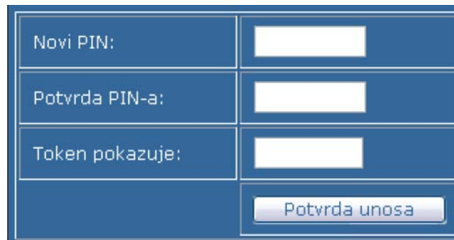
Слика 2. Дефинишете свој токенPIN (у дужини 4-8 алфанумеричких карактера), који уписујете у поље „Нови PIN”. У пољу „Потврда PIN-а” још једном уписујете исти токенPIN, док у пољу „Токен показује” уписујете број који у том тренутку показује токен.

КОРАК 2: Бирате опцију „Иницијализација токена” (Слика 2).